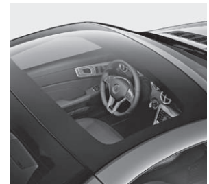
Panorama-Variodach mit MAGIC SKY CONTROL