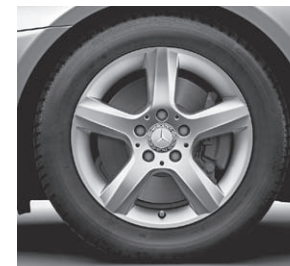
40,6 cm (16") Leichtmetallrad im 5-Speichen-Design (R19)