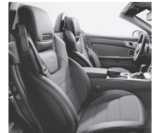
AMG Sportsitze mit Ledernachbildung ARTICO/Stoff