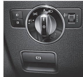
Feststellbremse elektrisch mit Komfortfunktion