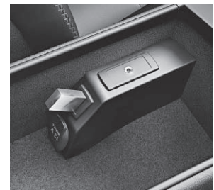
USB-Schnittstelle und AUX-IN- Anschluss in der Mittelkonsole