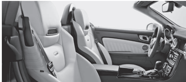
designo Leder Exklusiv einfarbig