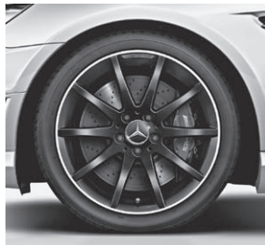
45,7 cm (18") AMG Leichtmetallrad im Vielspeichen-Design, Mattschwarz lackiert (760)