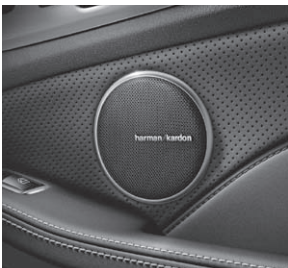
Harman Kardon® Logic7® Surround-Soundsystem