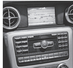
Becker® MAP PILOT für Audio 20 CD