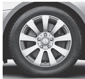
40,6 cm (16") Leichtmetallrad im 9-Speichen-Design (R12)