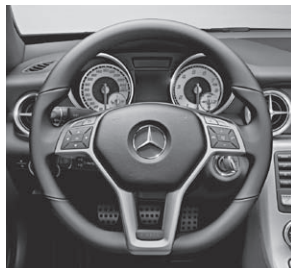
Multifunktionslenkrad im 3-Sp.-Design, unten abgeflacht