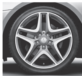
45,7 cm (18") Leichtmetallrad im 5-Doppelspeichen-Design (22R)