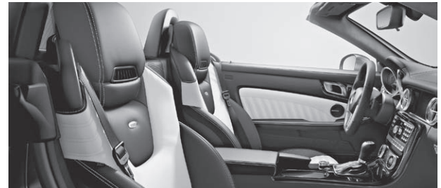
designo Leder Exklusiv zweifarbig