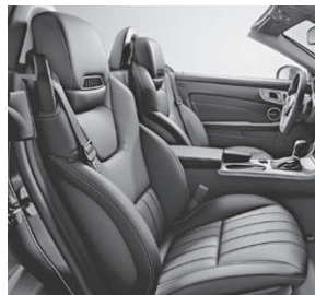
Sitze im spezifischen Längspfeifen-Design