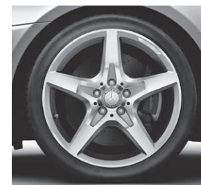
45,7 cm (18") AMG Leichtmetallrad im 5-Speichen-Design (782)