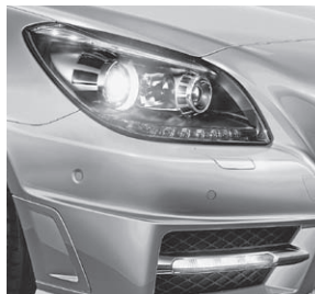
Intelligent Light System (Darstellung mit Sport-Paket AMG)