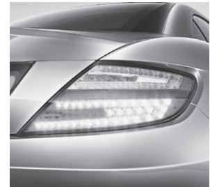
Heckleuchten in LED-Technik