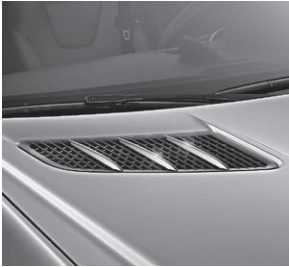
Finnenaufsätze für die Motorhaube