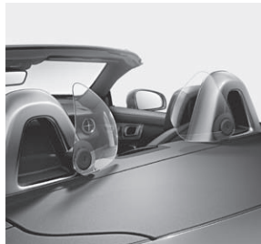
AIRGUIDE und Überrollbügel mit Einleger Aluminium eloxiert