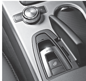
Dach-Bedieneinheit und zentrales Bedienelement