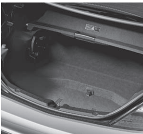
Kofferraum mit Wendeboden