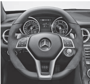
AMG Performance Lenkrad in Leder Nappa/Mikrofaser DINAMICA