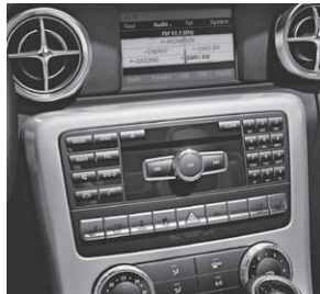
Audio 20 CD