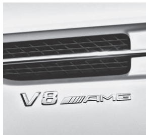
»V8 AMG« Schriftzug