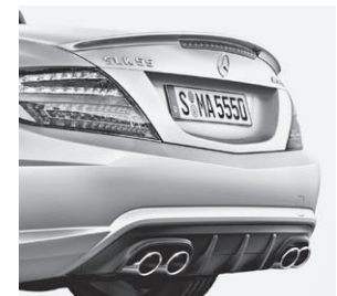
AMG Heckschürze, Abrisskante und Sport-Abgasanlage