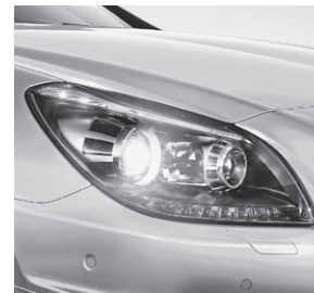
Scheinwerfer mit dunkler Einfassung