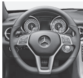
Multifunktions-Sportlenkrad mit Perforation und roter Ziernaht