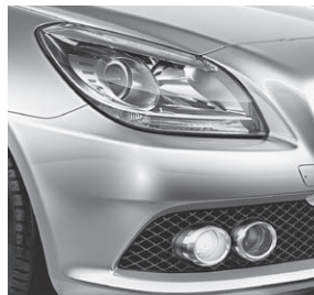
Klarglas-Scheinwerfer, Tagfahrlicht und Nebelscheinwerfer