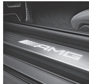
AMG Einstiegsschienen beleuchtet