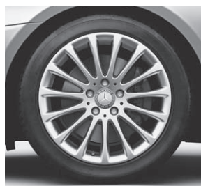
43,2 cm (17") Leichtmetallrad im Vielspeichen-Design (R81)