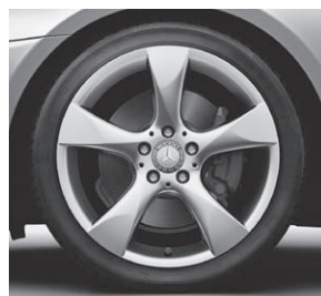
45,7 cm (18") Leichtmetallrad im 5-Speichen-Design (R32)