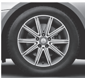
43,2 cm (17") Leichtmetallrad im 10-Speichen-Design (R93)