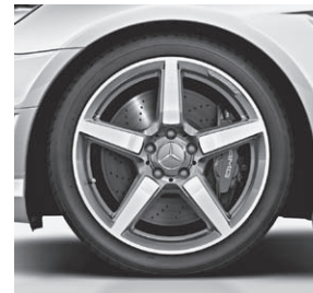
45,7 cm (18") AMG Leichtmetallrad im 5-Speichen-Design (790)